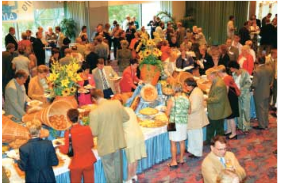
Valion juustobuffet oli menestys myös Tampereen vuosikokouksessa.

- 50 %. Kun lisäksi huomioidaan vielä erilaisten palkallisten lisien korotukset