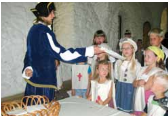
Lapset retkeilivät Leipuripäivillä Olavinlinnassa Pietari Brahen jalanjäljillä.

Liiton 109. vuosikokous ja kesäpäivät pidettiin elokuussa Savonlinnassa 420 osallistujan voimin. Tapahtumaa isännöi ja emännöi Pohjois-Karjalan Leipomoyrit-