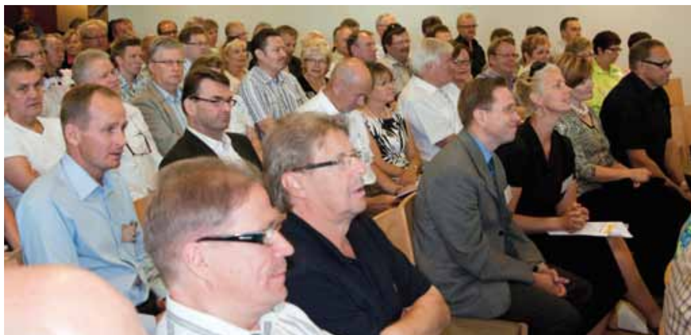
Vuoden 2009 vuosikokous pidettiin Savonlinnassa.