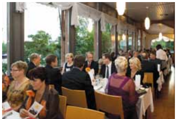
Vuosikokouksen illallisella oli tunnelma korkealla Savonlinnan Wanhän Kasinin tiloissa.