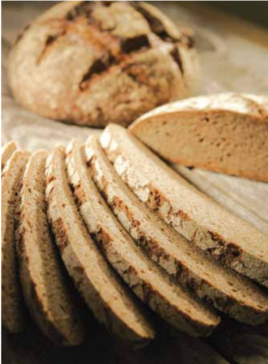
Taantuma käänsi ruisleivän kulutuksen hienoiseen laskuun.

koskevassa myyntitilastossa on mukana leipomoalan volyymista noin 80 %. Ko. myyntitilaston lukuja voidaan siten pitää suuntaa-antavina, joten johtopäätöksiä koko alan kehityksen osalta voi varovasti tehdä. Ko. myyntitilaston mukaan vaa-leaa ruokaleipää toimitettiin 90,1 miljoonaa kiloa, joka on 3 % vähemmän kuin vuonna 2008. Tummaa ruokaleipää toimitettiin 75,6 miljoonaa kiloa, joka on 2 % vähemmän kuin edellisenä vuonna. Kahvileipää toimitettiin 21,4 miljoonaa kiloa, joka on 6,8 % vähemmän kuin vuonna 2008. Tilasto osoittaa mm. sen, että monta peräkkäistä vuotta kestänyt