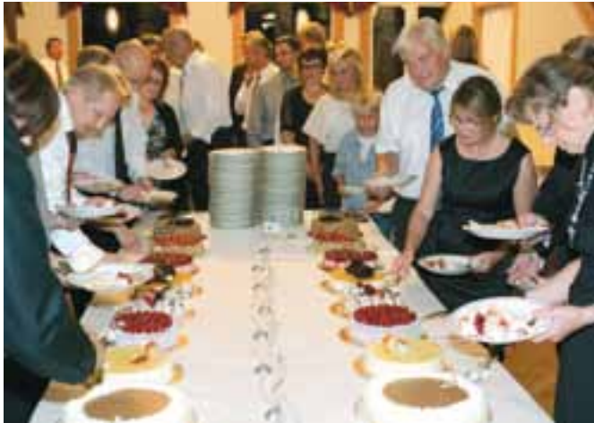
Vuosikokousillallisen kakkupöytä keräsi jonoa, kun kaikki halusivat maistaa Pohjois-Karjalan leipureiden valmistamia herkkuja.