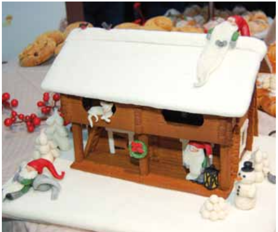
Leipomoiden SM-joukkuekilpailun hopeasijan saaneen Konditoria CoCo Ay:n joukkueen piparkakkutalossa oli rentoa tunnelmaa.