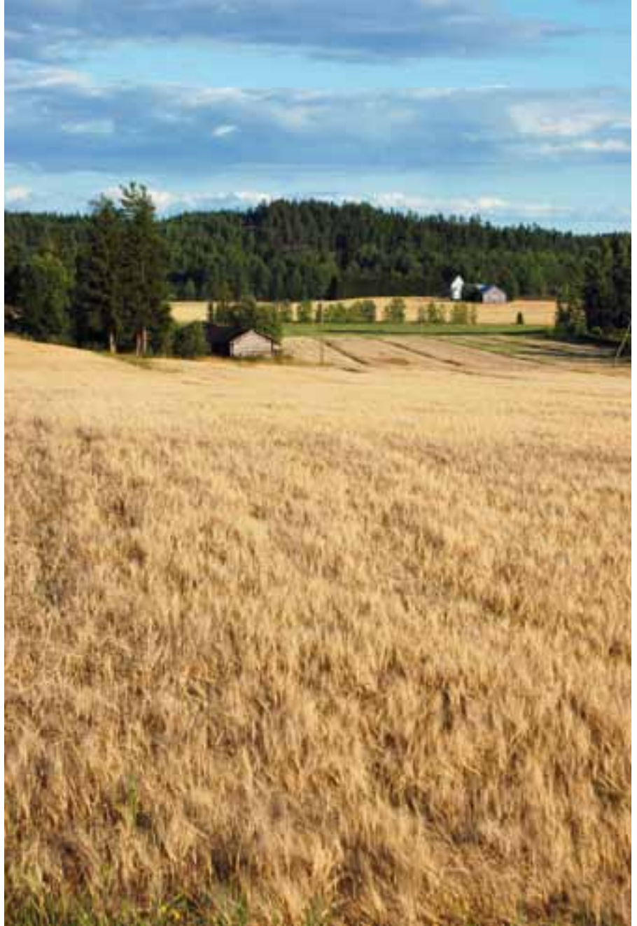
Vuoden 2009 kokonaisviljasato oli 4,3 miljardia kiloa.

Tilastokeskuksen työtaistelutilaston mukaan Suomessa käytiin 139 työtaistelua vuonna 2009 ja niistä yli kaksi kolmasosaa eli 99 käytiin teollisuudessa. Työtaisteluita oli selvästi enemmän kuin edellisenä vuonna, jolloin niitä oli 92 kappaletta. Työtaisteluihin osallistuneiden työntekijöiden lukumäärä oli noin 50 500 eli yli kolminkertainen edelliseen vuoteen verrattuna ja vastasi vuosikymmenen keskimääräistä tasoa. Menetettyjä työpäiviä oli noin 92 000. Työpäivämenetykset moninkertaistuvat edellisestä vuodesta ja ne olivat 2000-luvun kolmanneksi suurimmat, vaikka jäivätkin vuosikymmenen keskiarvosta vuosien 2000 ja 2005 suurten työpäivämene-