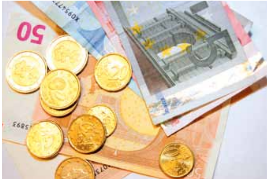
Kotitalouksien käytössä olevat tulot kasvoivat vuonna 2009 lamasta huolimatta.

Tärkeimmäksi vientimaaksi nousi Saksa, jonka viennin arvo oli 4,6 mrd. euroa ja osuus kokonaisviennistä 10,3 %. Toiseksi suurin vientimaa oli Ruotsi 9,8 %:n osuudella. Venäjä putosi edellisen