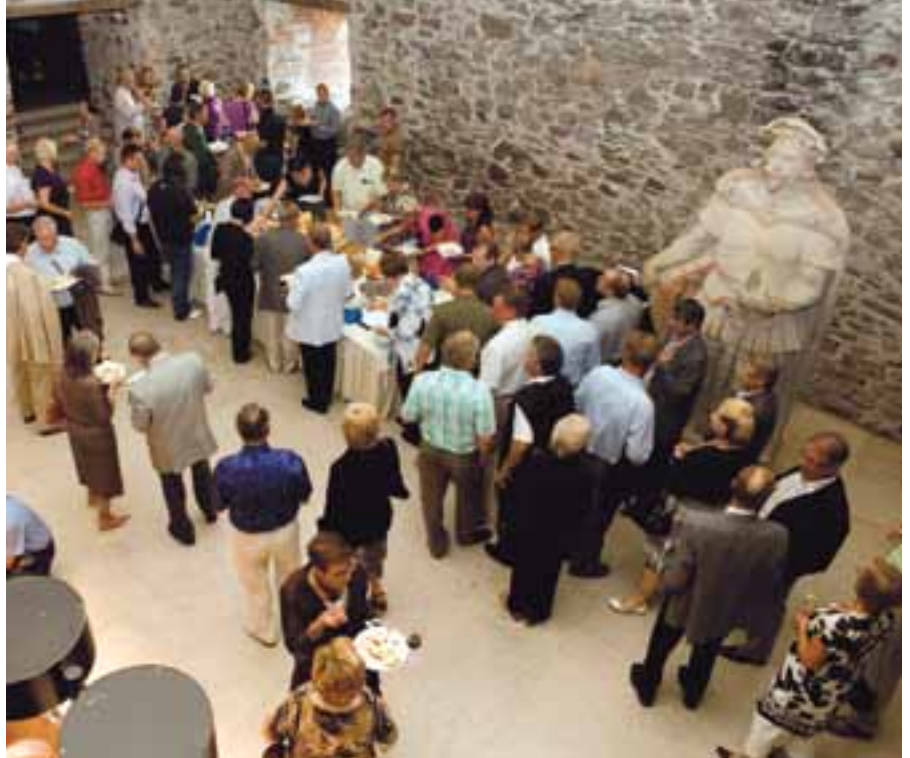
Leipuripäivien suosituista Valion juustobuffetista nautittiin tunnelmallisessa Olavinlinnan kuninkaansalissa.